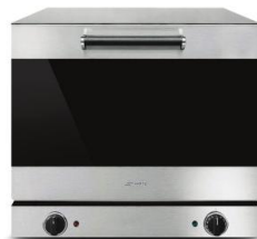
연관제품 ALFA43K *검은유리