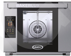
연관제품 샵프로 *TOUCH